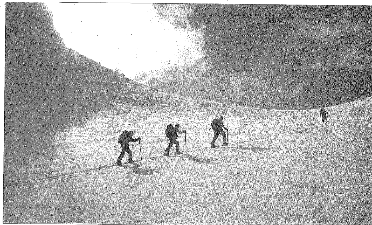
Le parcours d'initiation alterne les parties plates et des pentes plus exigeantes. Et le matériel est également fourni.

Une fois les consignes de sécurité assimilées, la montée peut débuter. Pour permettre à tous de s'initier, la structure prête gratuitement, lors de la première journée, tout ce dont peut avoir besoin un débutant : Arva, pelle, sonde, skis, peaux, bâtons et chaussures. Sans oublier des vêtements techniques disponibles en test à la